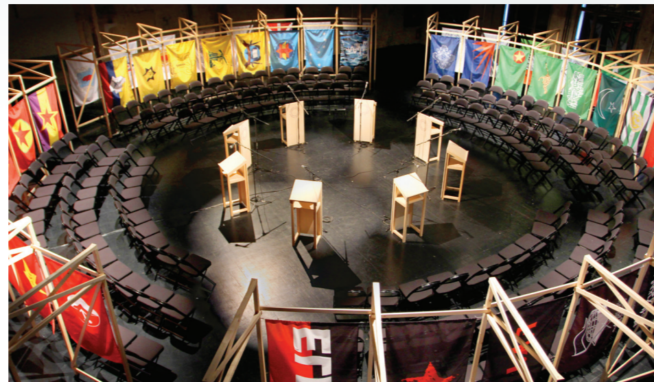
Studio Jonas Staal, New World Summit: Berlin , 2012. Overview parliament of the New World Summit in Sophiensaele, Berlin./Studio Jonas Staal, New World Summit: Berlin , 2012. Oversikt over parlamentet New World Summit i Sophiensaele i Berlin.

The New World Embassy is one of three organizations created and run by Studio Jonas Staal. The first New World Embassy: Azawad was developed in 2014 in BAK, basis voor actuele kunst, an art gallery in Utrecht, in collaboration with the National Liberation Front of Azawad, a Kel-Tamasheq-led multiethnic movement that attempts to establish its own autonomous state in northern-Mali. The second organization is the New World Summit (2012–ongoing), that consists of temporary parliaments for stateless organizations, created—amongst others—in Berlin (2012), Brussels (2014), and Rojava (2015–16). The third organization is the New World Academy (2013–15), co-founded with BAK, that takes the form of an educational platform to teach artists and students on the role of art in stateless political struggle.