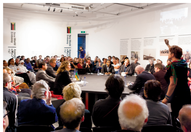
Inauguration of the New World Embassy: Azawad , BAK, basis voor actuele kunst, Utrecht, 2014./Åpning av New World Embassy: Azawad , BAK, basis voor actuele kunst, Utrecht, 2014.