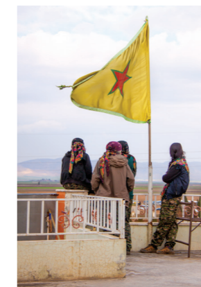
Jonas Staal, Anatomy of a Revolution: Rojava . Special forces of the Women's Defense Units (YPJ) look out over their training camp situated near Qamişlo, 2015./Jonas Staal: Anatomy of a Revolution:Rojava . Spesialstyrker fra kvinnenens forsvarsenhet YPJ ser ut over treningsleiren i nærheten av Qamişlo, 2015.